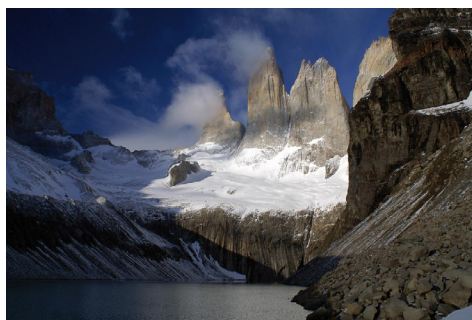
Torres del Paine, Čile