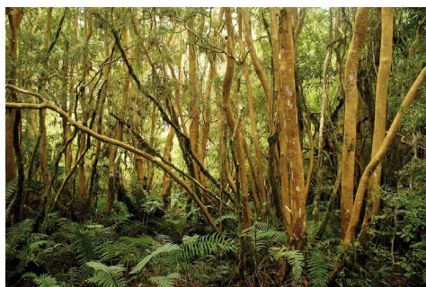
Na upätí vulkánu Osorno, Čile