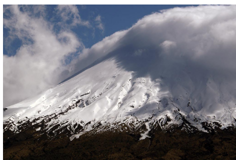
Vulkán Osorno, Čile